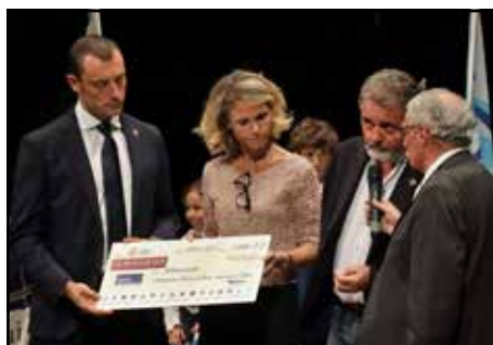
In alto la consegna del Superprestige 2022 al Comitato Palio Castell'Alfero e sopra il momento di solidarietà.