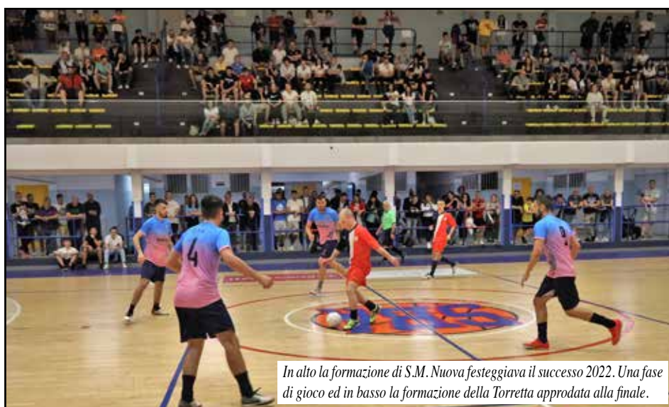
In alto la formazione di S.M. Nuova festeggiava il successo 2022. Una fase di gioco ed in basso la formazione della Torretta approdata alla finale.