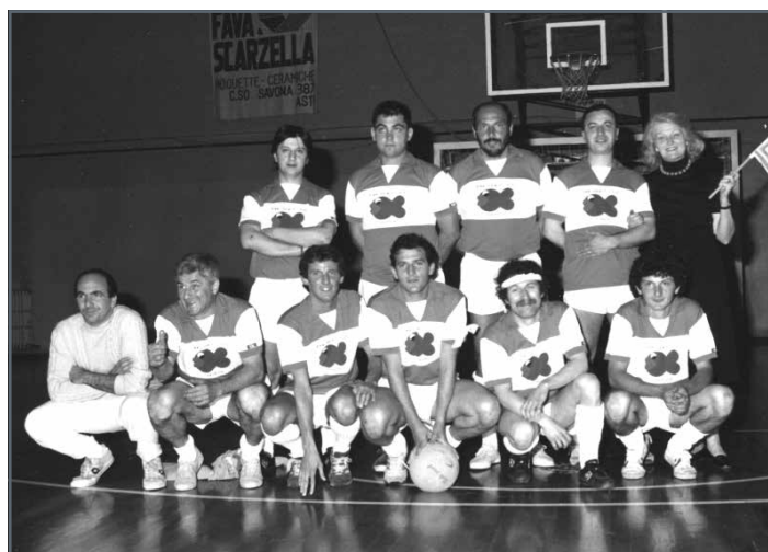
La formazione della Cattedrale vincitrice dell’edizione 1988

Anche nel 2012, in occasione della serata finale del Torneo dei Borghi di calcio a 5, si sarebbe dovuta disputare la sfida del “ventennale” relativa al 1992, ancora tra S.Secondo e Cattedrale. Ad imporsi nel 1992 fu la Cattedrale che, dopo 2 finali consecutive perse contro S.Secondo (1990 e 1991), riuscì ad iscriversi per la 2ª volta il proprio nome sull’Albo d’Oro della manifestazione. A distanza di 4 anni dal “sigillo” del 1988